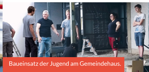
Baueinsatz der Jugend am Gemeindehaus.