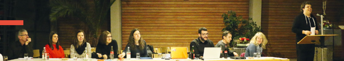
Der Vorstand bei der Jahreshauptversammlung.