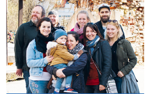
Historischer Rundgang durch Kamnik mit der Gruppe von JMEM.

Anfang April, zu Ostern, kam eine Gruppe von JMEM (Jugend mit einer Mission) aus Köln, die uns einige Tage unterstützt hat. Ich war Hauptverantwortliche für die Gruppe und die gemeinsamen Aktionen. Wir hatten Zeiten für Gebet, Lobpreis, evangelistische Aktionen. Das Highlight war der Afrikaabend, der in der bekanntesten Kneipe in Kamnik stattfand. Die Gruppe hat von ihren Erlebnissen in der Mission erzählt und Bilder dazu gezeigt. Dieser Abend war sehr besonders, auch für unsere eigene Gemeinde. Leider ist von 400 persönlich verteilten Einladungen niemand gekommen, obwohl wir viele Zusagen hatten. Ich schreibe das, damit ihr einen kleinen Eindruck bekommt, wie schwer es hier ist, Menschen zu erreichen, auch durch öffent-