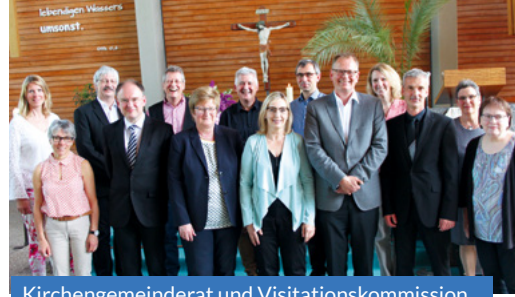
Kirchengemeinderat und Visitationskommission

Wir haben wahrgenommen, dass der Außenblick auf unsere Gemeinde an vielen Stellen deutlich positiver ist, als wir es intern wahrnehmen. Und das, obwohl wir die Visitationskommission ausführlich über die Herausforderungen der letzten 10 Jahre informiert haben. Am Ende einer Visitationswoche stehen immer Zielvereinbarungen, die zwischen der Kommission und dem Kirchengemeinderat getroffen werden. Den Wortlaut der Vereinbarungen können Sie