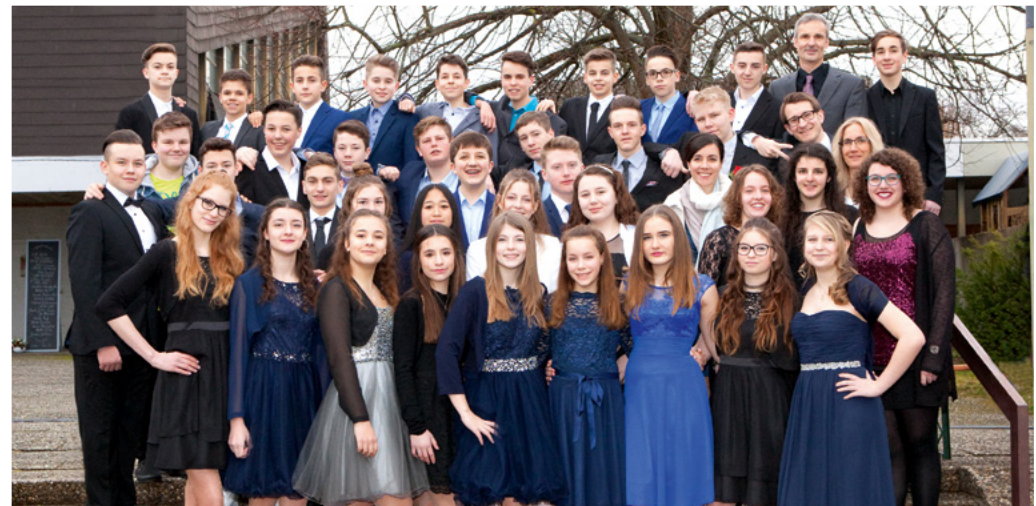
Oben Goldene Konfirmation (Jahrgang 1968)